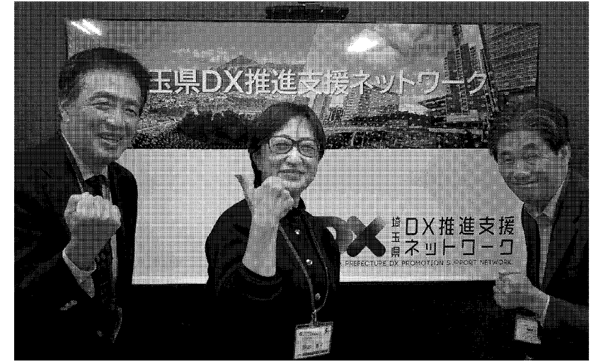
3人のDXコンシェルジュが中小企業のDX導入を支援する

業から企画書と概算見積もりが提示され、それをコンシェルジュが利用。具体的な埼玉DXパートナーの紹介まで行えるのが利点。埼玉県独自の取り組みで、DX導入に向けて複数の企業からの提案を入手できるため、自社に最適なソリューションを選びながらコスト比較も可能だ。相談企業からは「デジタル化の観点から経営課題を整理する良い機会になった」との声が寄せられた。 昨年8月から今年10月までに107社がコ